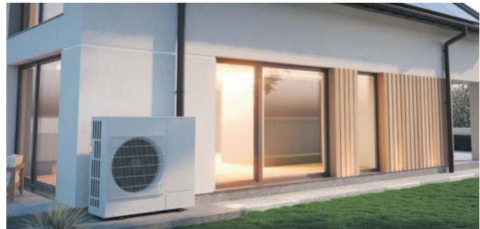
Die Wärmepumpe versorgt das Haus mit Strom vom eigenen Dach

Wer zusätzlich eine Wärmepumpe betreibt, kann künftig mit eigenem Sonnenstrom heizen. „Wärmepumpen nutzen Energie aus Luft, Boden oder Wasser und benötigen nur Strom für den Antrieb. Das senkt die Heizkosten spürbar und reduziert den CO 2 -Ausstoß deutlich“, so Lehmeier. Auch Elektrofahrzeuge lassen sich einbinden. Mit einer intelligenten Ladebox wird das Laden zum festen Bestandteil des Energiesystems. Überschüssiger Solarstrom lädt das Auto entweder direkt oder zeitversetzt über den Batteriespeicher – günstig, sauber und unkompliziert. So entsteht ein aufeinander abgestimmtes System, das die Kosten senkt,