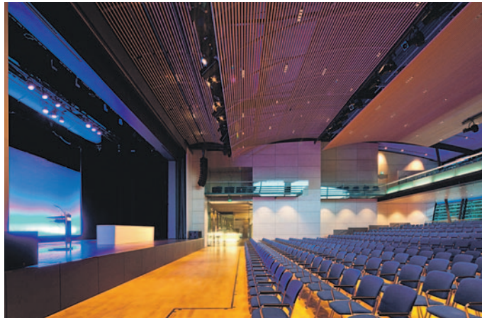
Die Stühle müssen nach gut 24 Jahren ausgetauscht werden.

Der Stadtrat hat der Bereitstellung der erforderlichen Haushaltsmittel in Höhe von etwa 400.000 Euro für die Neubeschaffung von insgesamt 1.200 Großraumstühlen für das Veranstaltungsforum Fürstenfeld (950 Stühle für den Stadtsaal und 250 Stühle für den Säulensaal) zugestimmt. Nach über 24 intensiven Nutzungsjahren sei der Austausch der Bestuhlung