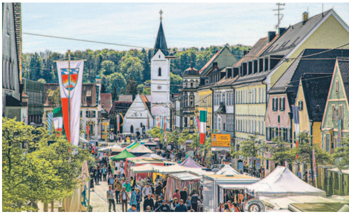
Bummeln durch die Innenstadt – ohne Autoverkehr ein Genuss.

Die Taxi-Standplätze der Hauptstraße sind in der Maisacher Straße vor dem Bio-Markt zu finden.