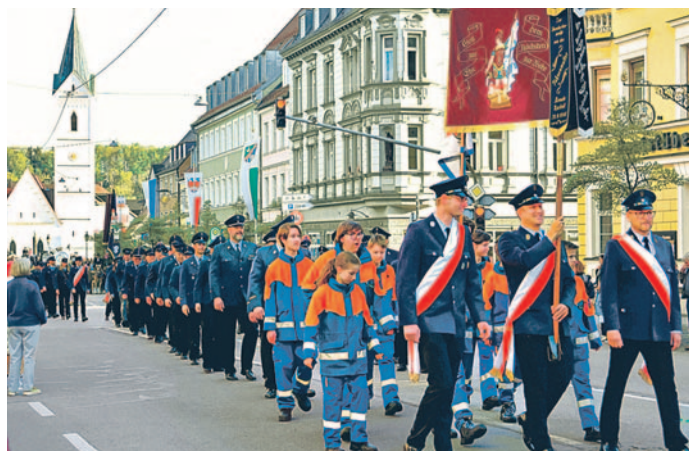
Der Festzug zum Volksfestplatz findet heuer wieder am Samstag statt.

Buchen Sie Ihr Ticket einfach und bequem online unter www.fuerstenfeldbruck.de/stadtfuehrungen .