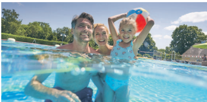
Die Sommersaison im Freibad beginnt

Ein Stück Badegeschichte verabschiedet sich