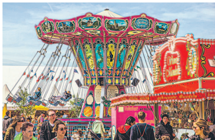
Das Kettenkarussell ist nach wie vor sehr beliebt.